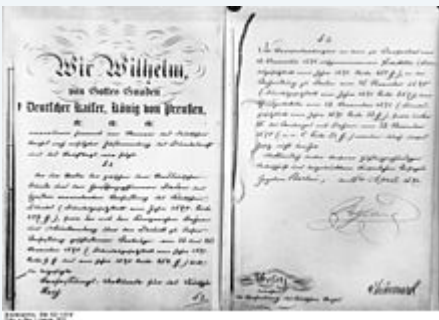
Erste und letzte Seite der Verfassungsurkunde von 1871 Bismarcksche Reichsverfassung

Nach dem Deutschen Krieg zwischen Österreich und Preußen 1866 gründete Preußen zusammen mit den anderen norddeutschen Staaten den ersten deutschen Staatenbund. Dieser Norddeutsche Bund erhielt eine Verfassung, die am 1. Juli 1867 in Kraft trat. Vereint hatte sie das Bündnis der beteiligten Fürsten einerseits und ein konstituierender Reichstag, der im Februar 1867 eigens für die Vereinbarung gewählt worden war. Die Verfassung des Norddeutschen Bundes oder Norddeutsche Bundesverfassung vom 16. April 1867 wurde maßgeblich im preußischen Staatsministerium unter Otto von Bismarck , dem preußischen Ministerpräsidenten, entworfen. Die Verfassung sah einen Bundesrath als Vertretung der Fürsten und einen vom Volk gewählten Reichstag vor, die gemeinsam Gesetze beschloßen. Ziel war es, jeden bundesstaatlichen Zentralismus unter ein Dach "Deutsches Reich" im Sinne des ewigen Bundes zu vereinen, der hohe Preis für Preußen war die bestehende preußische Hegemonie aufzugeben. Das Bundespräsidium steht dem König von Preußen zu und nur er ernannte den Bundes- bzw. Reichskanzler des Deutschen Reiches, des ewigen Bundes und des Nationalstaat Deutschlands.