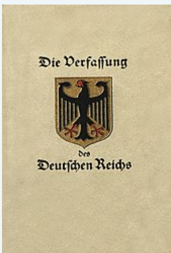
Bucheinband der Verfassung der Weimarer Republik von 1919

Weimarer Republik-Verfassung ist keine Reichsverfassung, sie ist auch keine demokratische Verfassung, da diese durch einen Putsch, Verfassungshochverrat, Wahlbetrug, ein Nichtverfassungsorgan und dem Hochverrat am Deutschen Volk, am Bundespräsidium, am Bundesrath, am Reichstag und an der verfassungskonformen Reichsleitung, oktroyiert wurde.