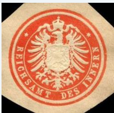
Siegelmarke Reichsamt des Innern

Das Reichsamt des Innern war die oberste Reichsbehörde im Deutschen Kaiserreich .